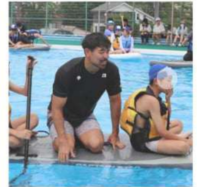
7月弥彦小学校にて水上安全教室